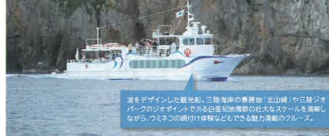
波をデザインした観光船。三陸海岸の景勝地「北山崎」や三陸ジオパークのジオポイントである白亜紀地層群の壮大なスケールを満喫しながら、ウミネコの餌付け体験などもできる魅力満載のクルーズ。